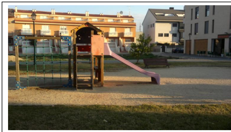
Foto 2. També a la plaça d'Ausiàs March observem que a la zona de jocs infantils no està habilitada amb la superfície de cautxú que la normativa europea UNE-EN 1177 obliga a instal·lar.

Foto 1. A la plaça d'Ausiàs March les plantes enfiladisses han creixcut desmesuradament oferint un aspecte descuidat de la plaça.