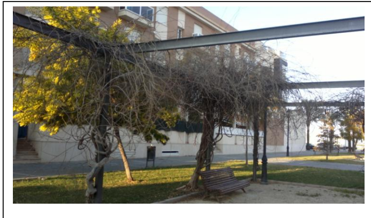
Foto 1. A la plaça d'Ausiàs March les plantes enfiladisses han creixcut desmesuradament oferint un aspecte descuidat de la plaça.

El BLOC-Compromís de Vinalesa posa a la disposició dels responsables municipals el següent dossier on s'especifiquen algunes deficiències a l'entorn urbà de Vinalesa que han sigut detectades pel mateix col·lectiu o per veïnes/ns que ens les han fet arribar.