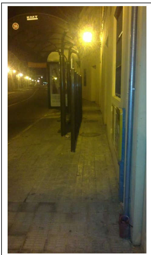
Foto 1. La marquesina de la parada d'autobús de la plaça del Castell dificulta el pas de vianants per la vorera, i més encara per a aquells ciutadans amb dificultats de mobilitat.

El BLOC-Compromís de Vinalesa posa a la disposició dels responsables municipals el següent dossier on s'especifiquen algunes deficiències a l'entorn urbà de Vinalesa en referència a elements que dificulten la mobilitat pels espais destinats als vianants. Aquestes deficiències han sigut detectades pel mateix col·lectiu o per veïnes/ns que ens les han fet arribar.